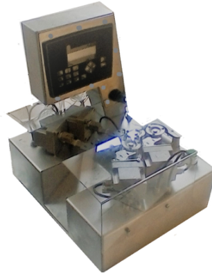
صورة غير تعاقدية